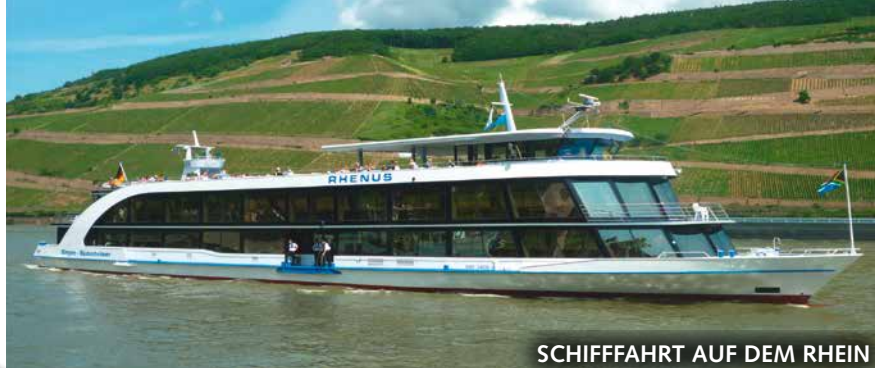
SCHIFFFAHRT AUF DEM RHEIN