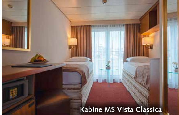
Kabine MS Vista Classica