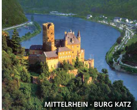
MITTEL RheIN · BURG KATZ

Exklusiv nur bei Weinkultureisen buchbar!